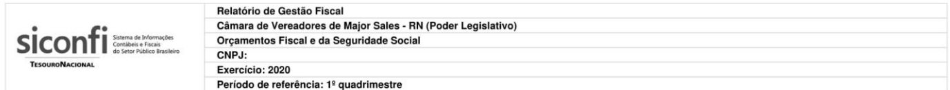
RGF-Anexo 01 | Tabela 1.2 - Trajetória de Retorno ao Limite da Despesa Total com Pessoal

ANO XVI - Nº1046- Major Sales-RN, sexta-feira, 29 de maio de 2020